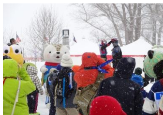
各種イベント実施