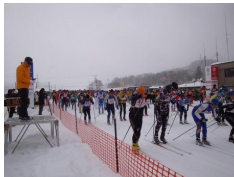
クロスカントリースタート風景