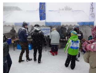
きのこ汁 (参加者無料)